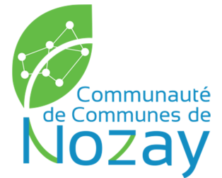
Région de Nozay