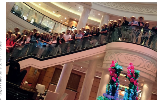
Encadrés par la Région Pays de la Loire et le club des 100, 36 jeunes ont travaillé sur le thème de « l'envie d'entreprendre » en participant à l'opération Jeunes sur le Pont dans le cadre de The Bridge.