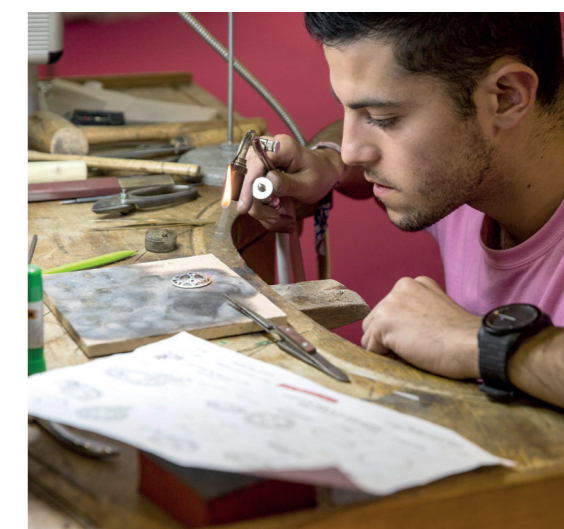
44 e éditions des Olympiades des Métiers - Sélections régionales - Pôles métiers : bijouterie joaillerie. Parc expo d'Angers (Maine et Loire) le 15 oct. 2016