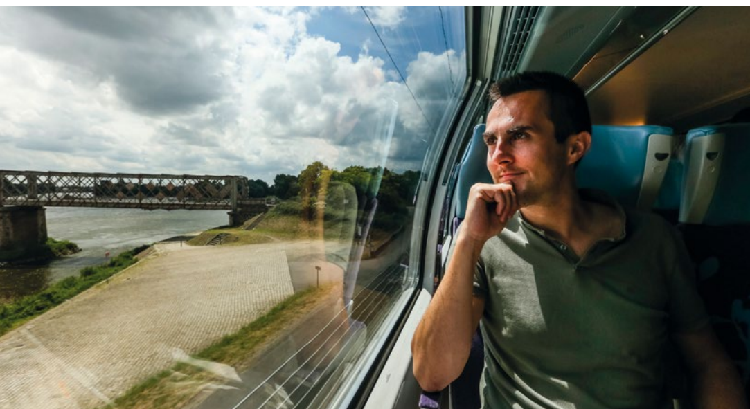
© Région Pays de la Loire / A. Monié - Les beaux matins

10 Rendre les gares et haltes ferroviaires rurales plus attractives et innovantes